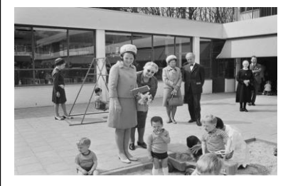
Prinses Beatrix bezoekt de Krabbebossen

zijn er voor een deel van hun jeugd opgegroeid en vragen zich achteraf af wat dat voor hen heeft betekend. Veel oud-medewerkers hebben er hun vak geleerd en werken nu in wijkteams of elders in de jeugdhulp, veelal in West-Brabant, of zijn met pensioen. Ervaringen van toen kunnen lering zijn voor de jeugdzorg van nu.